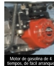
Motor de gasolina de 4 tiempos, de fácil arranque

Todo el rendimiento, portabilidad y facilidad de uso que un contratista espera conseguir lo encontrará en estas máquinas, extremadamente robustas, que han sido ensayadas y desarrolladas en base a las normas más estrictas y en los ambientes de trabajo más rigurosos.