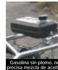
Gasolina sin plomo, no precisa mezcla de aceites